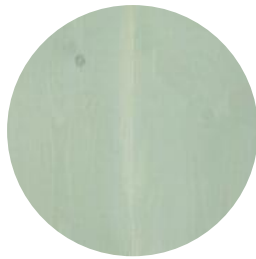
SALT LAKE GREEN