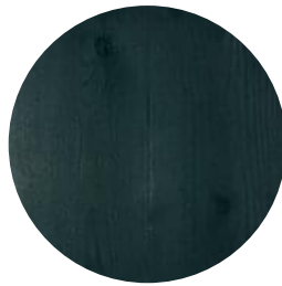
RUBIO MONOCOAT GREEN